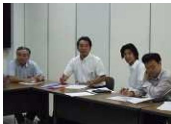
6月に開催した 県央ブロック合同委員会