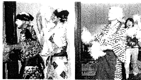
サンバに乗って登場したおてもやん

今回の全国大会開催地は秋田県。30日夜にホテルで開かれた懇親会では、熊本県が誇る(?) おてもやん