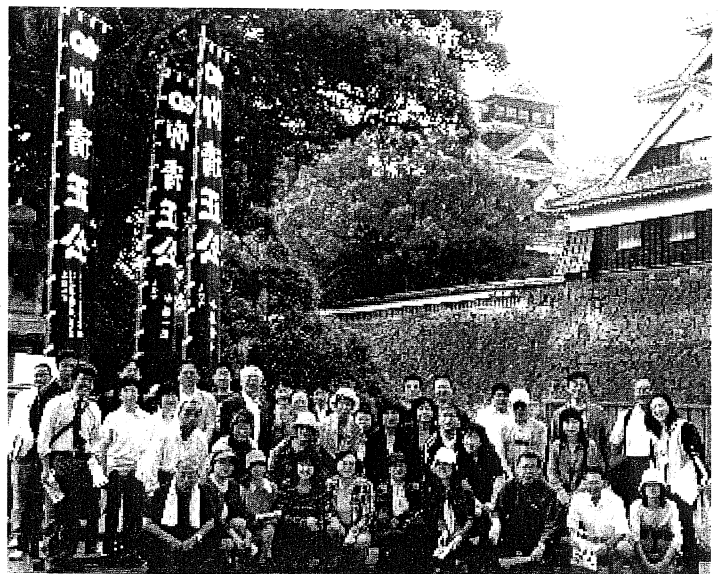
「早朝ウォーキング」の参加者。熊本城をバックに記念撮影

大会最終日の31日、熊本城を回る「早朝ウォーキング」を企画したところ、午前6時の出発にもかかわらず、50人近い参加がありました。 熊本県社会福祉士会メン