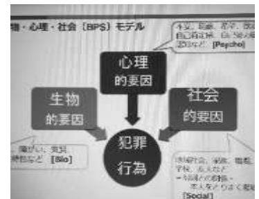
講話にあったBPSモデル