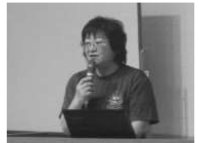
日本社会福祉士会総会報告