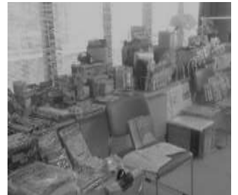
災害支援グッズの展示